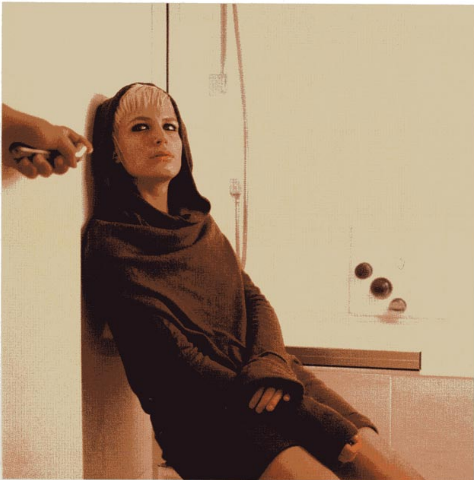
Pull à capuche Yohji Yamamoto chez Ultima