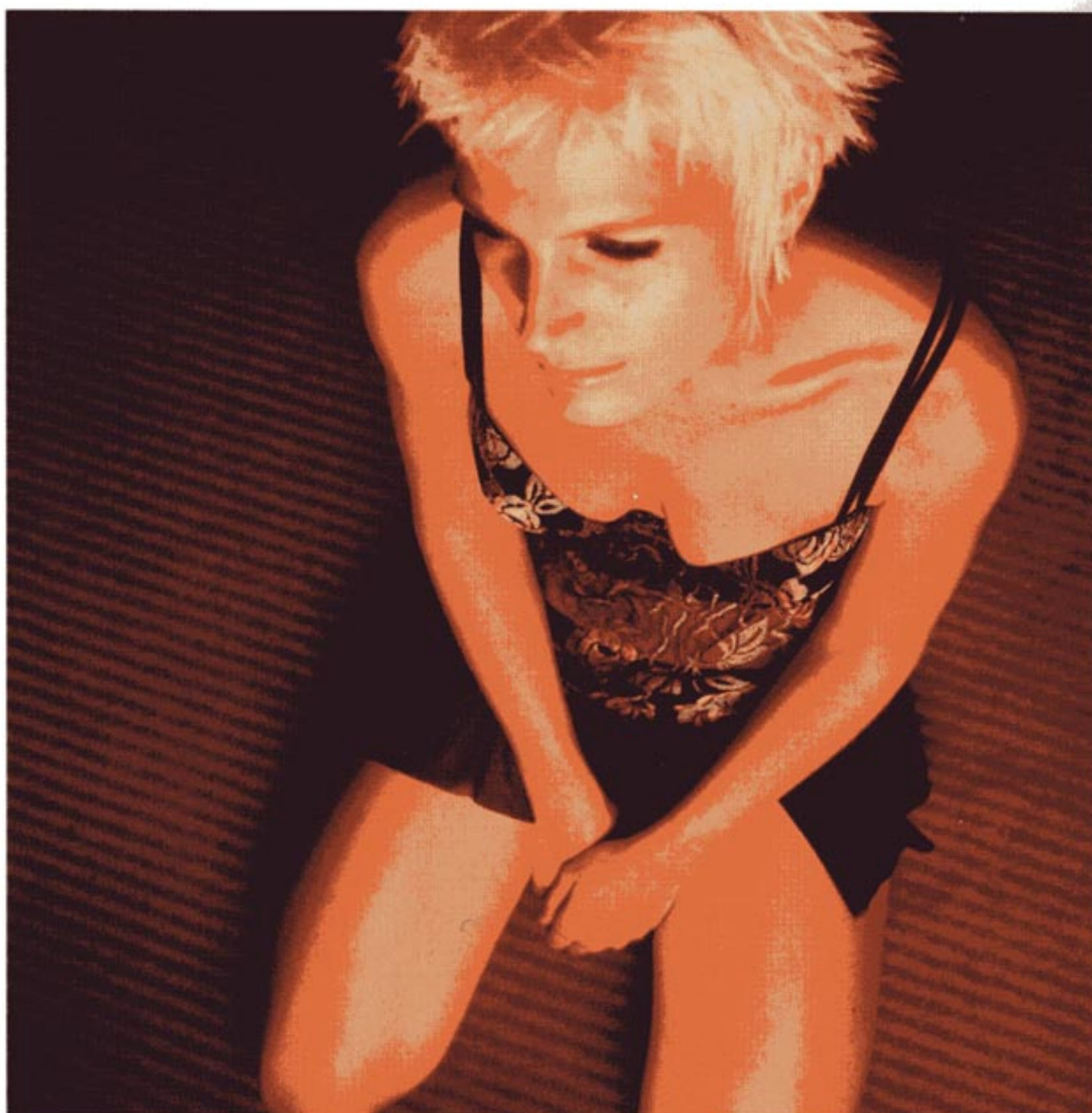
Nuisette et string Cotton club ligne Bayadem chez Porte C

4 petite rue de l'Église à Strasbourg Tél. 03 88 21 91 66