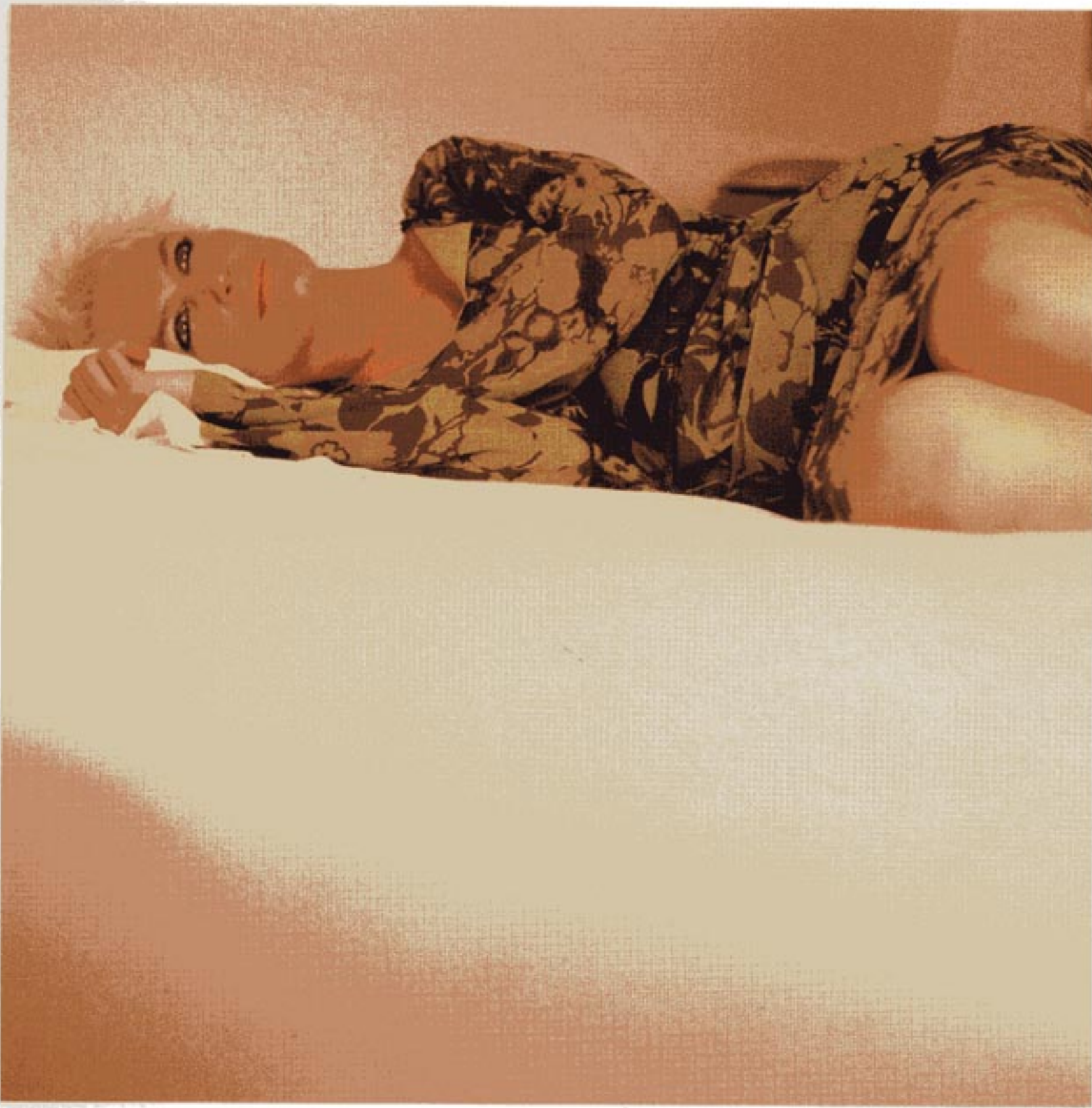
Robe Essentiel chez Marbre