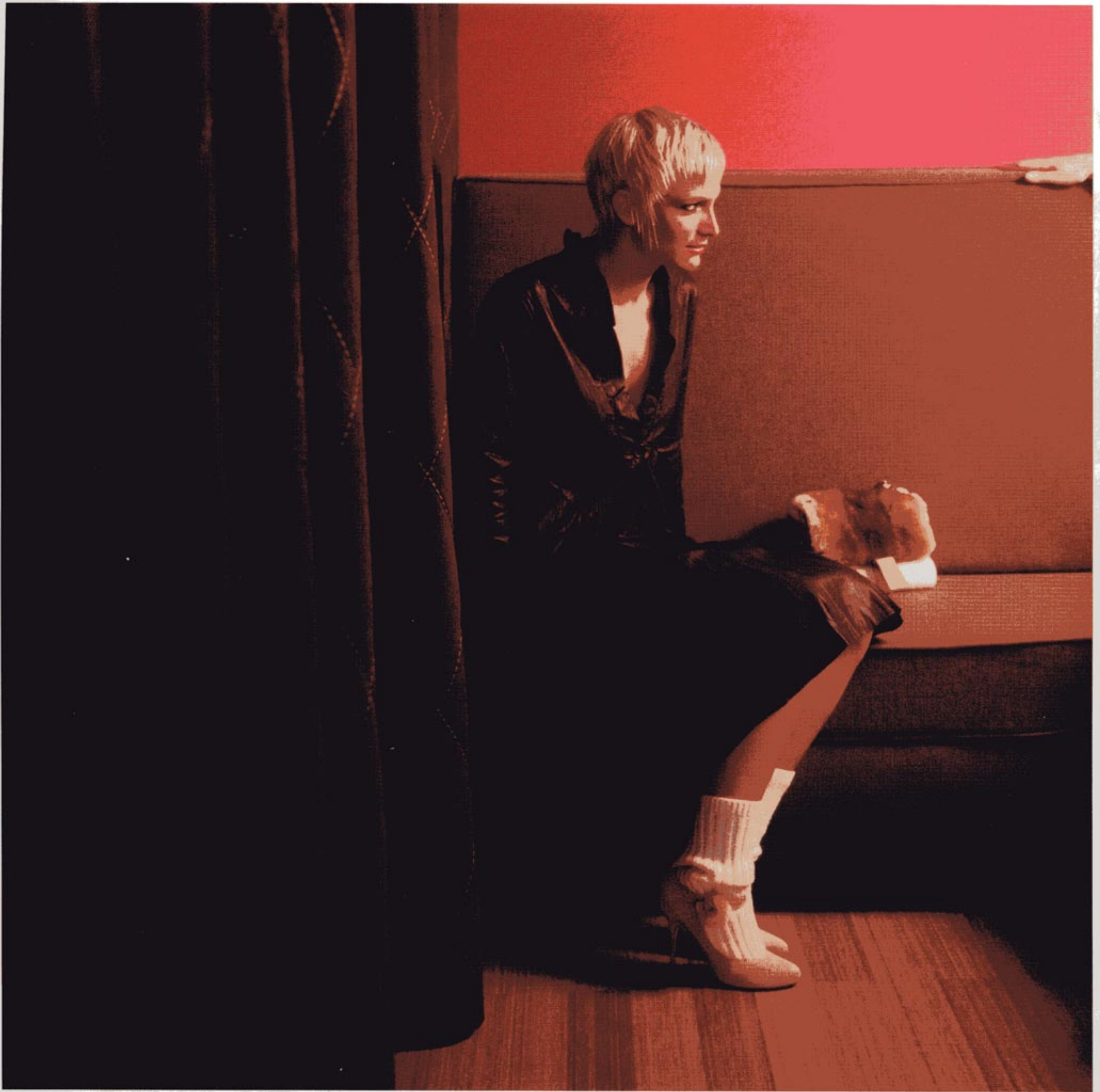
Ensemble jupe et veste en cuir Essentiel chez Marbre, bottines John Galliano et gants Givenchy chez Pulp