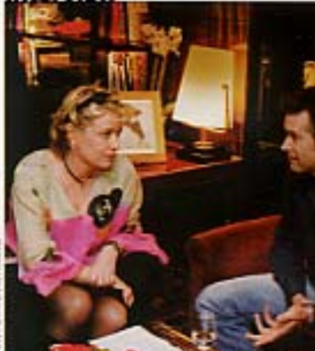
Sur le plateau du Fou du roi