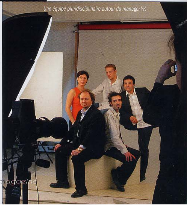
Une équipe pluridisciplinaire autour du manager YK